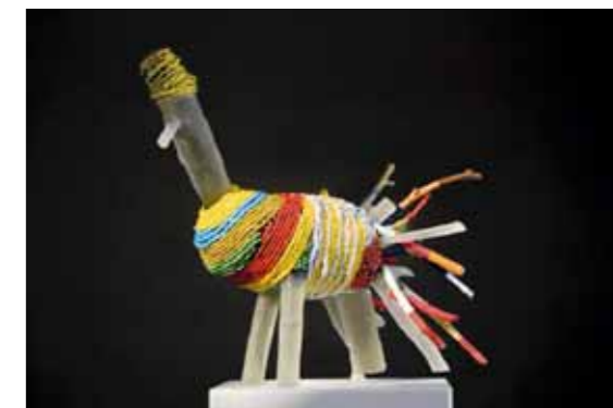
RASTABIRD, tavené sklo, korále, dřevo, 2006, 50–40–25 cm