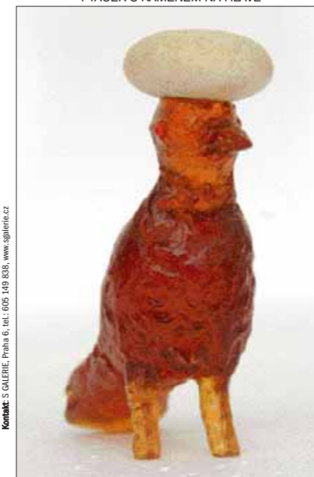
tavené sklo, kámen, 2010, 10–10–6 cm

Ceny soch (podle velikosti a náročnosti) od 12 000 do 900 000 Kč Kontakt: S GALERIE, Praha 6, tel.: 605 149 838, www.sgalerie.cz