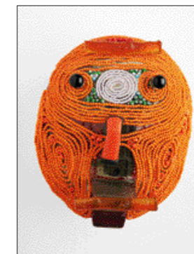
MASKA, tavené sklo, korále, 2009, 30–40–15 cm