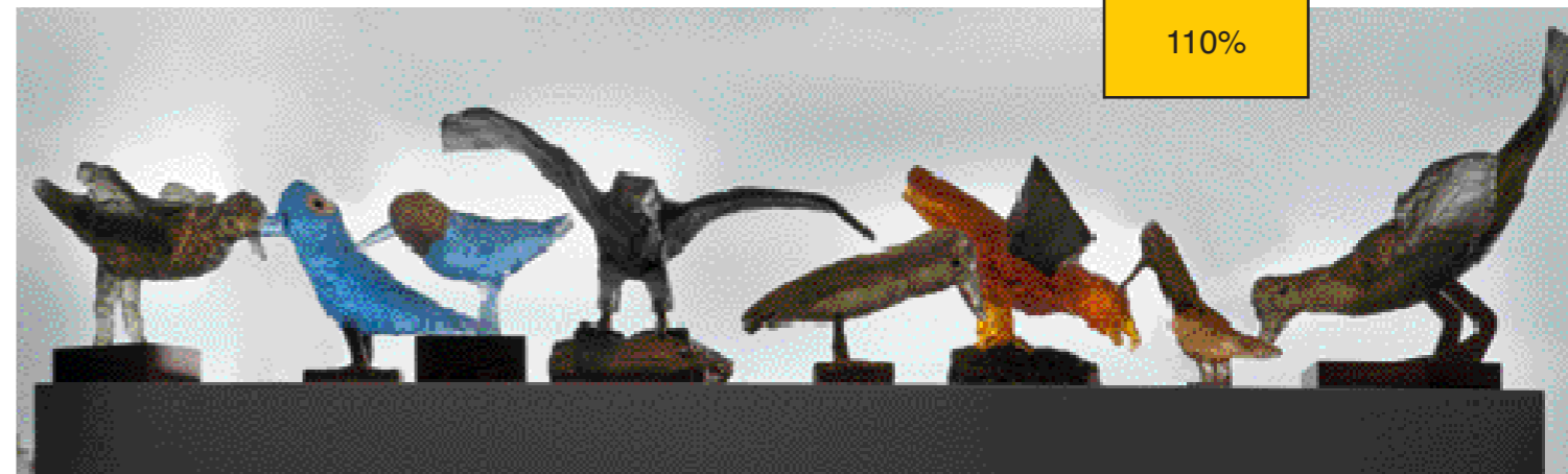
SKUPINA PTÁČKŮ, tavené sklo, 2011