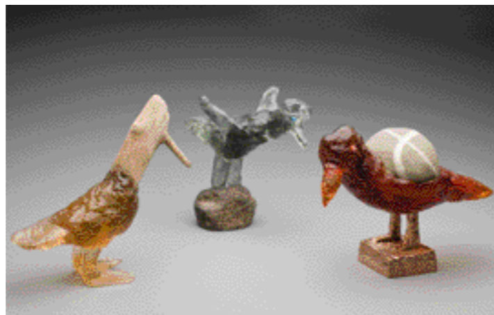
SKUPINA PTÁČKŮ, tavené sklo