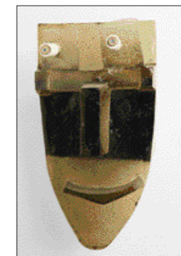
MASKA, tavené sklo, 2009, 50–25–15 cm