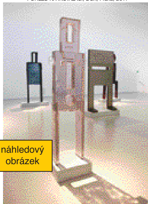
POHLED NA INSTALACI, DOX, Praha, 2011