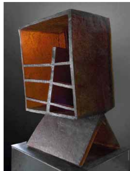
INTIMNÍ PŘÍTEL, tavené sklo, 2006, 40–30–80 cm

TEXT: Alena Kodová